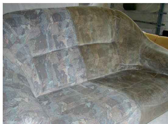
Links ná reiniging door Chem-Dry

dankzij de (nieuwe) bescherm laag blijft het tapijt langer schoon.