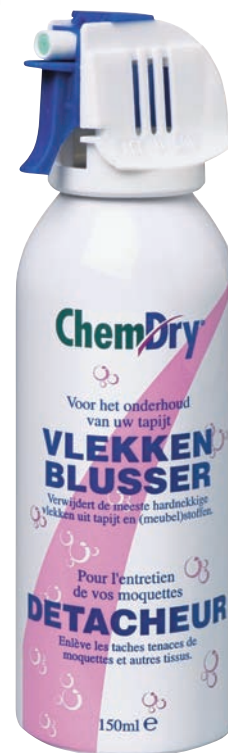
Chem-Dry vlekkenblusser voor de hardnekkige vlek

Naast het reinigen met de koolzuurmethode en het aanbieden van specialistische oplossingen voor moeilijke vlekken, houdt Chem-Dry zich ook bezig met het voorkomen van vlekken en het beschermen van vezels. Bij een reiniging van het meubilair of tapijt, kan namelijk meteen een vuilwerende bescherm laag aangebracht worden. Hierdoor trekt vuil minder snel in de vezels en is de vlek makkelijker te verwijderen.